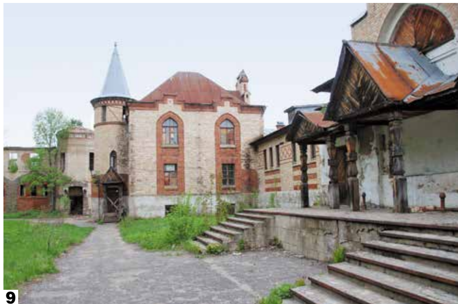
8 Дворец. 2015 г.

Опыт разработки Концепции показал, что для сложных объектов, отягощенных комплексом различных проблем, необходима разработка программы стратегического планирования, предусматривающая решение юридических, имущественных, территориальных, социальных и других вопросов, определяющая дальнейшее использование, дающая рекомендации и программу действий для пользователя.