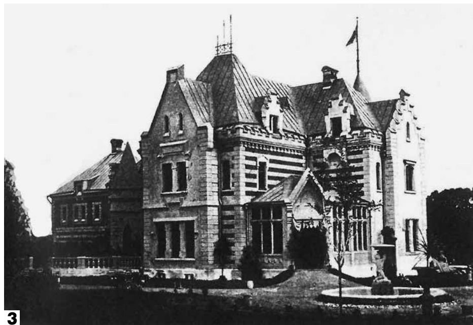
1 Каскады, вид от дворца в сторону парка. Открытка начала XX в.

Судогодский район практически окажется на крупной туристической трассе, и это позволит создать туристические гостиницы, мотели, кемпинги, детские и молодежные лагеря, оздоровительные центры. Такое логичное для Судогды и района развитие экономики на основе туризма и традиций природосберегающего