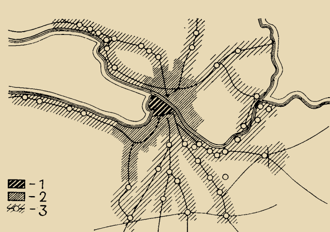
Рис. 1. Планировочная структура ленинградской системы расселения 1 – центральные районы 2 – новые районы массового жилищного строительства 3 – планировочные направления

С 1964 г. А.В. Махровская – заведующая отделом реконструкции городов научного отделения ЛенНИИП градостроительства. Научно-исследовательская деятельность отдела развивалась в двух направлениях: разработка современных проблем развития градостроительства Ленинграда и Европейского Севера.