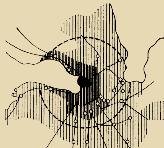
Рис. 2, 3. Схема города и его окружения в радиусе 50 км (выделены центральные районы и основные транспортные направления)