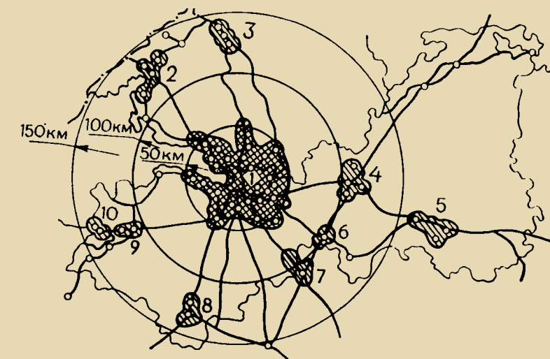
Рис. 4. Региональная система расселения (из работ А.В. Махровской)