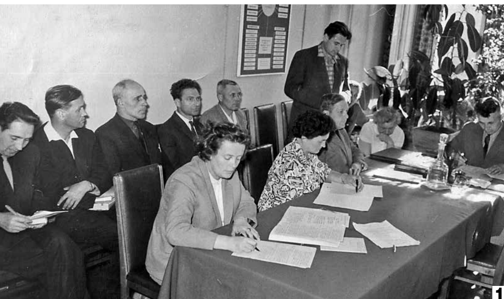
1 На совещании депутатов районного совета